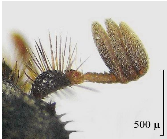
Fig. 2. Antena derecha normalmente conformada.