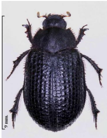
Fig. 1. Hábitus de Trox cotodognanensis Compte.